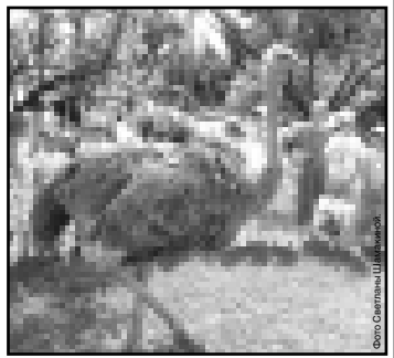
Дуниша красуется перед гостями.